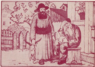
„אוי, וויי איז מיר“ . . .

און ער האט זיך ניט געלאזט טרייסטן: — איך וועל שוין אזוי אן אבל גיין אין קבר אריין! און ער האט זיך געזעצט שבעה נאך זיין זון.