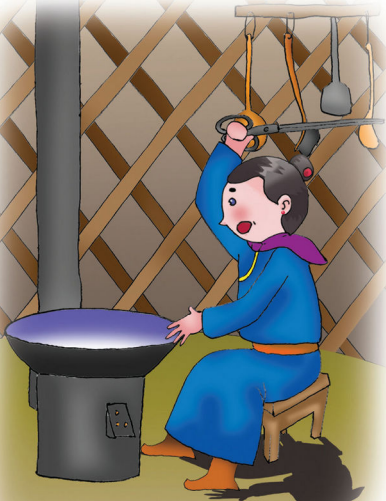
Цайгаа чанаж суусан эхийн чихэнд охиных нь дуу сонсдож, нүдэнд нь өлөн чоно үзэгдэх шиг болоход галын хайчаараа дохин "Жов!" гэлээ.